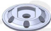
Skeletime Adapter Pad Kit

Il Pad Totem è stato concepito principalmente per offrire un bilanciamento pesi ottimale ad utilizzo delle interfacce brevettate Skeletime(Interfacce) oppure con il suo inserto di gomma(Insert Rubber) per lavorazioni delle plastiche o conversione a comune platorello.